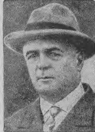
prezydent Urugwaju, na którego dokonano zamachu rewolwerowego

Wyróżnia się wśród Innych twarz Pani o wyglądzie świątym i powabnym, o cerze matowej, delikatnej, wiośnianej... Oto skutki działania odmładzającego wschodniego płynu Mimoza, Perfection.