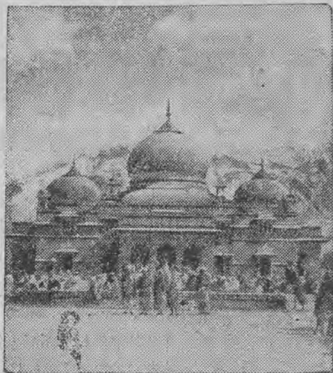
Jak doniosły depezy w Beludżystanie w Indjach miało miejsce silne trzęsienie ziemi wskutek którego miasto Quetta zostało całkowicie zniszczone. Liczba zabitych obliczana jest na 60.000 osób. Na ilustracji widzimy jeden z najwspanialszych i najpiękniejszych gmachów Quetta.