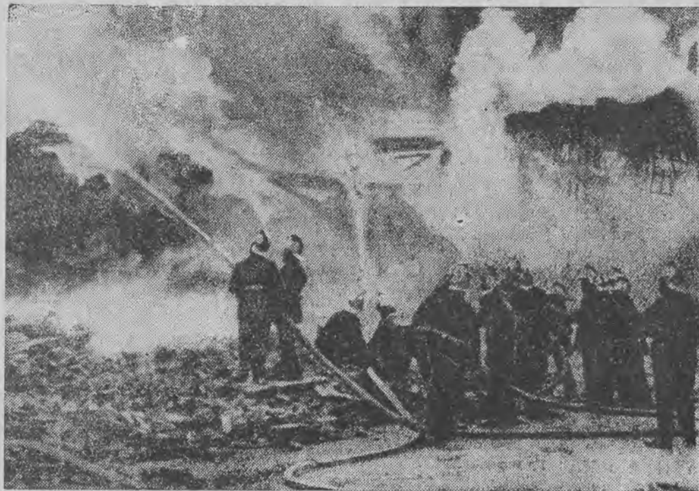
W dokach londyńskich padła pastwą olbrzymiego pożaru fabryka juty. Walkę z szalejącym żywiołem prowadziło 300 strażaków, przyczem wskutek zawalenia się muru dwaj strażacy stracili życie, a kilku odniosło poważne rany.