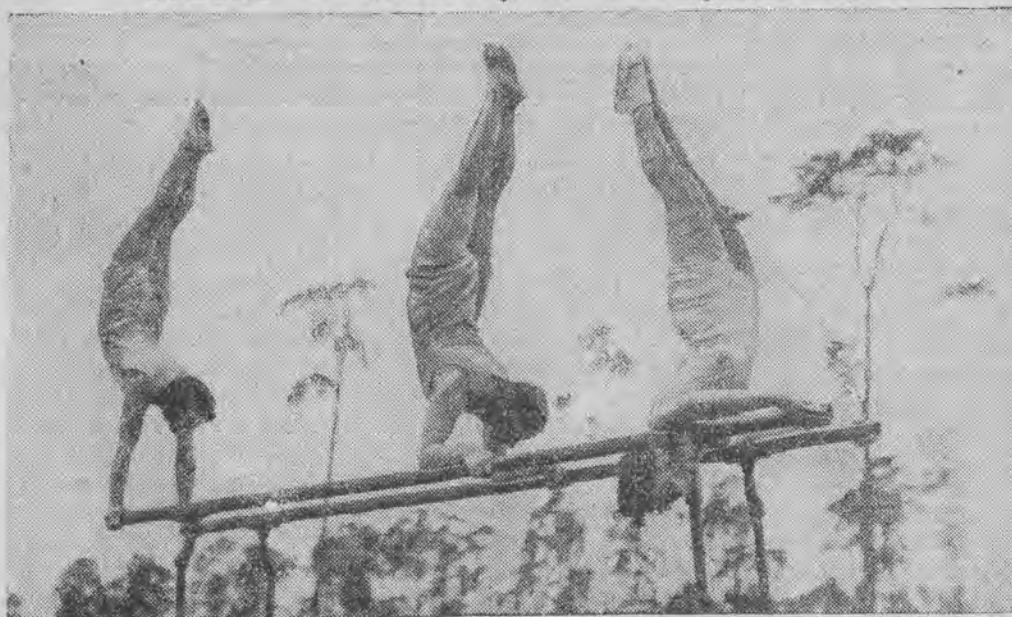
Ćwiczenia na poręczach, które nie każda kobieta potrafi naśladować.