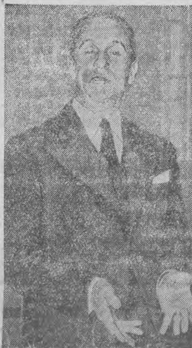
Plk. de la Rocque

PARYŻ, 12. 7. (PAT). Dzienniki donoszą, że KOMUNIŚCI OTRZYMAŁI ROZKAZ ZAATAKOWANIA POLICJI. Sztab partji oblicza swe siły na 600 tys. ludzi i jest pewien zwycięstwa. Pewność tę opiera także na