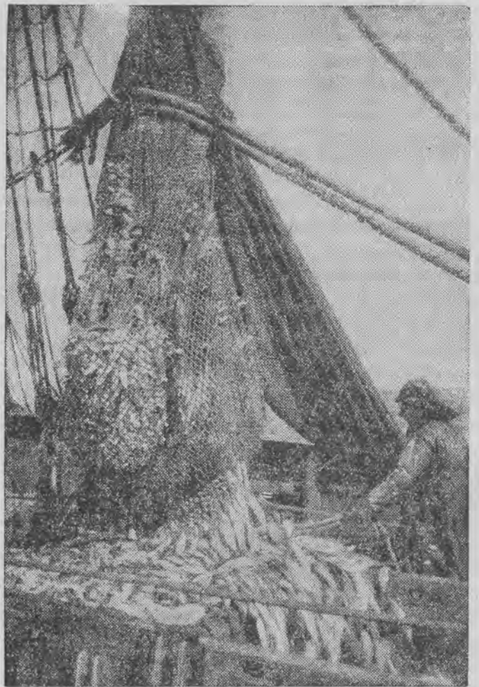
Lipiec i sierpień są miesiącami połowu śledzi. Po dniu ciężkiej pracy największą przyjemnością dla rybaka jest widok pełnych sieci.