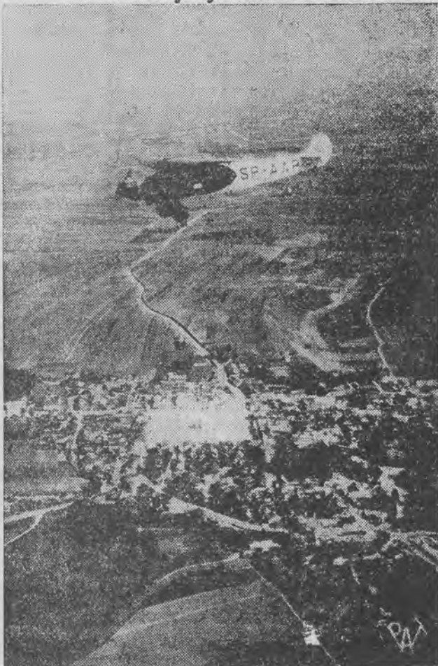
Polski samolot komunikacyjny, 10-osobowy Fokker ponad wyżyną krakowską.