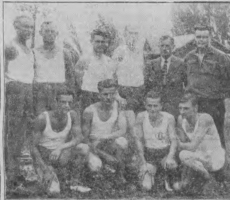
Drużyna K. S. Kruschender