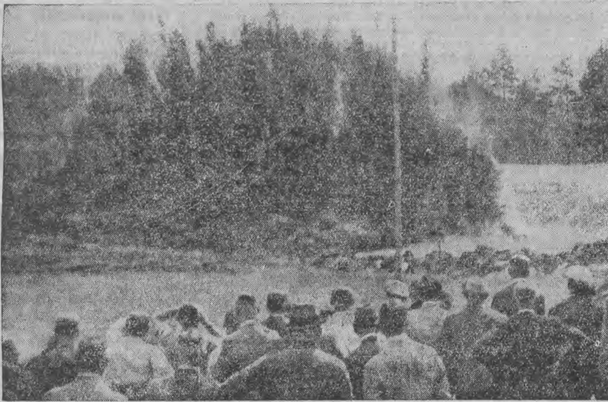
W czasie budowy nowej autostrady w Niemczech zaszła potrzeba osuszenia ogromnego trzęsawiska, przez które miała właśnie prowadzić nowa droga. Celem ułatwienia tej pracy wysadzono dynamitem w powietrze całe trzęsawisko. Na zdjęciu tłumy publiczności przyglądają się temu niezwykle widowisku.