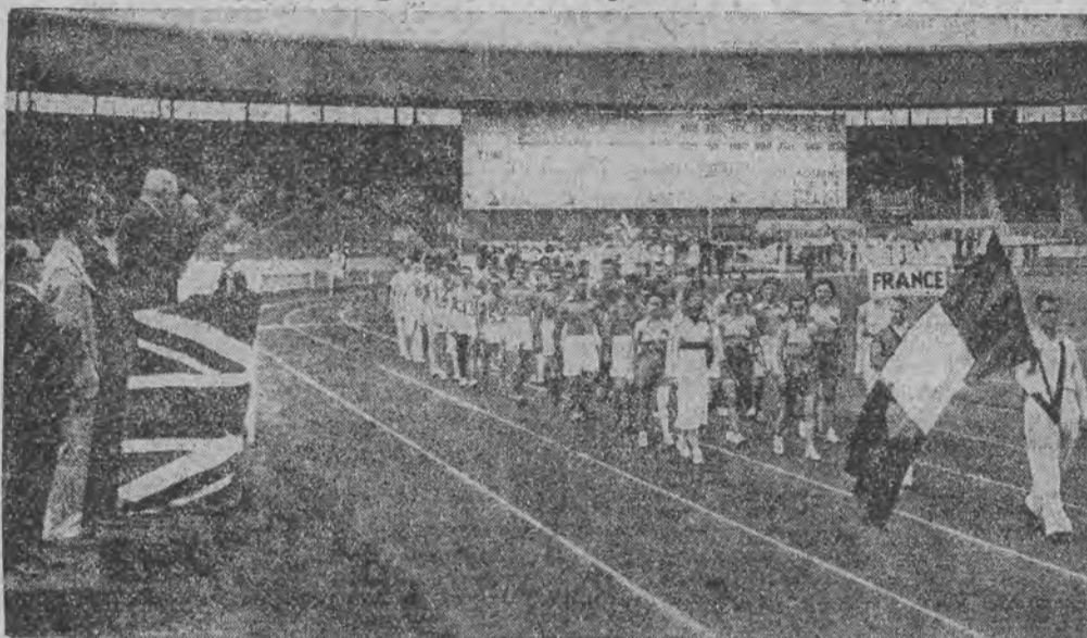
Na zdjęciu widzimy uroczysty moment otwarcia olimpiady głuchoniemych w Londynie przy udziale 14 państw.