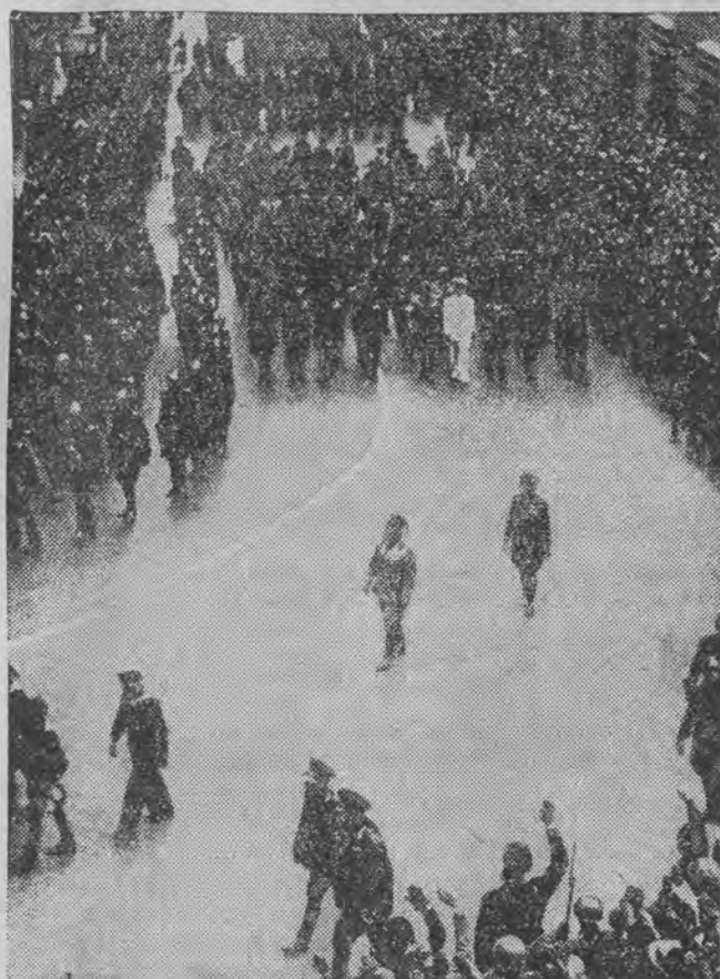
W kondukcje pogrzebowej ofiary katastrofy lotniczej pod Kairem, włoskiego min. robót publicznych Razza, wzięło udział w Rzymie przeszło ćwierć miliona ludzi. Na ul. ustraceni II Duce, kroczącej za trumną

Dzieci ociemniałe czekają na twą pomoc—zapisz się więc do Łódzkiej Rodziny Radjowej