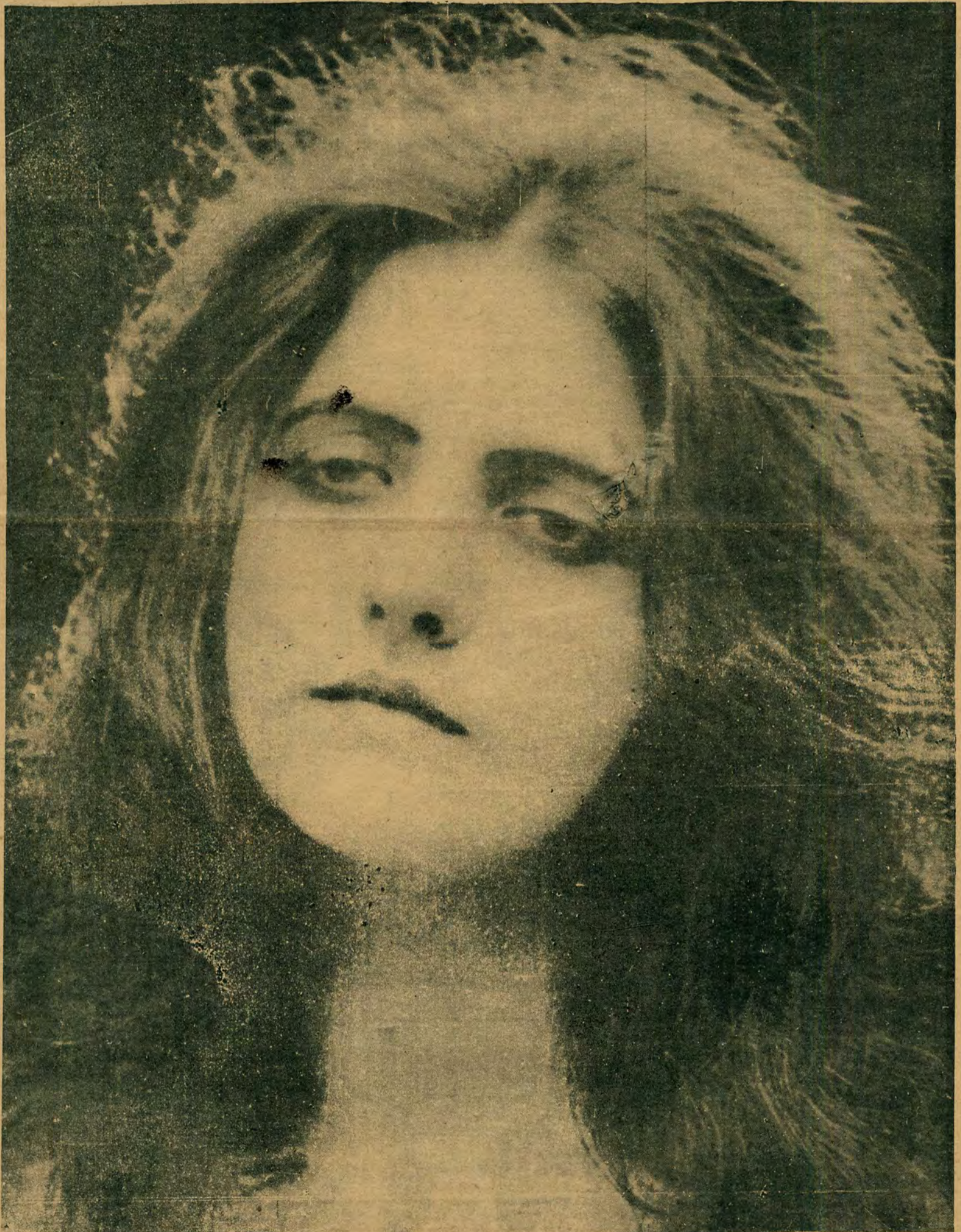
Gwiazda filmu polskiego.