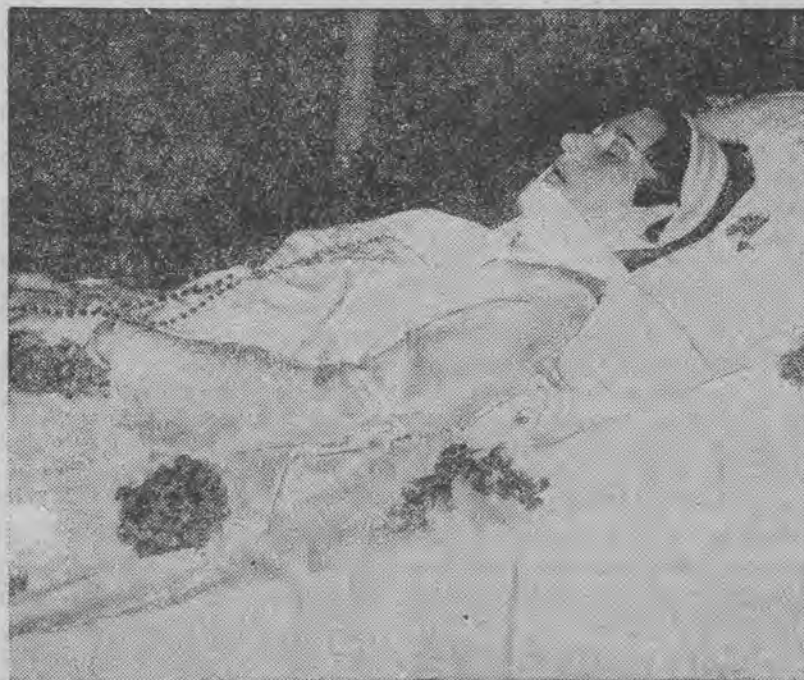
Zwłoki królowej Astrid na katafalku

BRUKSELA, 2 września (Pat.) Zawiązał się komitet budowy pomnika królowej Astrid w miejscu jej tragicznego zgonu. Uczyniono już odpowiednie kroki wobec władz szwajcarskich w celu nabycia terenu, na którym będzie wzniesiony pomnik.