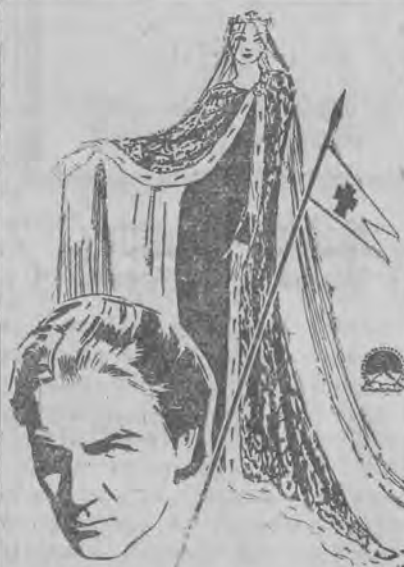
WYPRAWY KRZYŻOWE reż. Cecil B. de Mille'a

Kwestia czy wszczęta zostanie ponownie sprawa Nowińskiego o zabójstwo jest problematyczna. W czasie bowiem popełnienia zbrodni obowiązywał przepis kodeksu postępowania karnego, mocą którego rewidzja procesu dokonana być mogła jedynie na korzyść oskarżonego. Ma to zresztą ze względu na stan zdrowia Nowińskiego znaczenie jedynie czysto prawne.