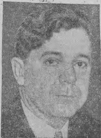
Huey P. Long

krwi sen. Long. w godzinę zaś potem przystąpiono do operacji. Ogłoszony przed południem biuletyn głosi, że stan chorego jest zadawalający.