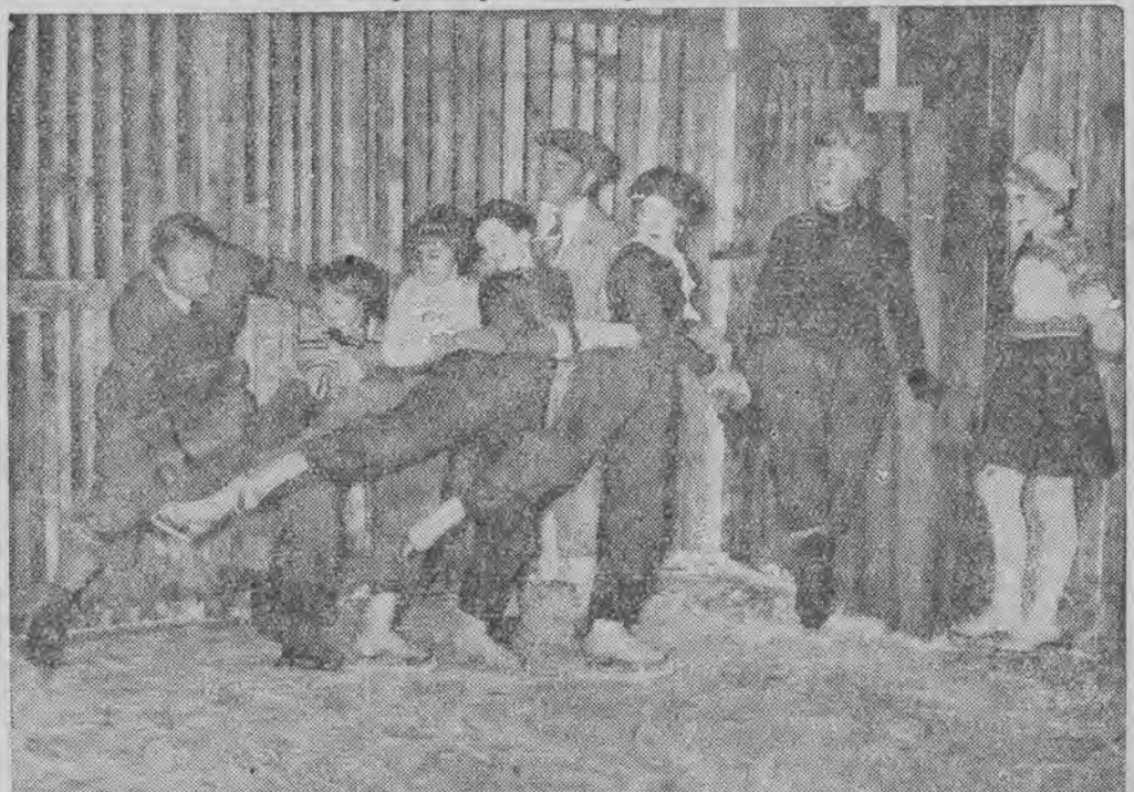
W Berlinie uruchomiono szkołę jazdy na łyżwach, która czynna jest cały rok. Latem otrzymuje się sztuczną powłokę lodową w specjalnej celi, chłodzonej nowoczesnymi metodami.