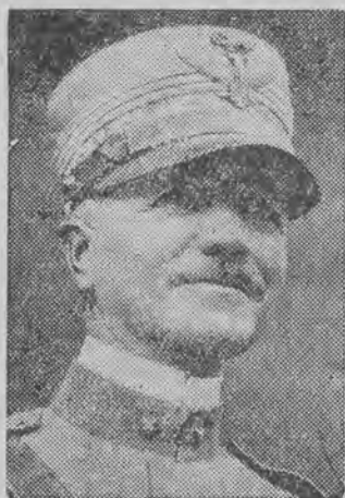
MARSZAŁEK BADOGLIO, szef włoskiego sztabu generalnego wyjechał na front abisyński.

PARYŻ, 18.10. (PAT) — Według informacji, napływających ze wszystkich źródeł należy się spodziewać na froncie północnym rozwoju ofensywy włoskiej w kierunku Makkale.