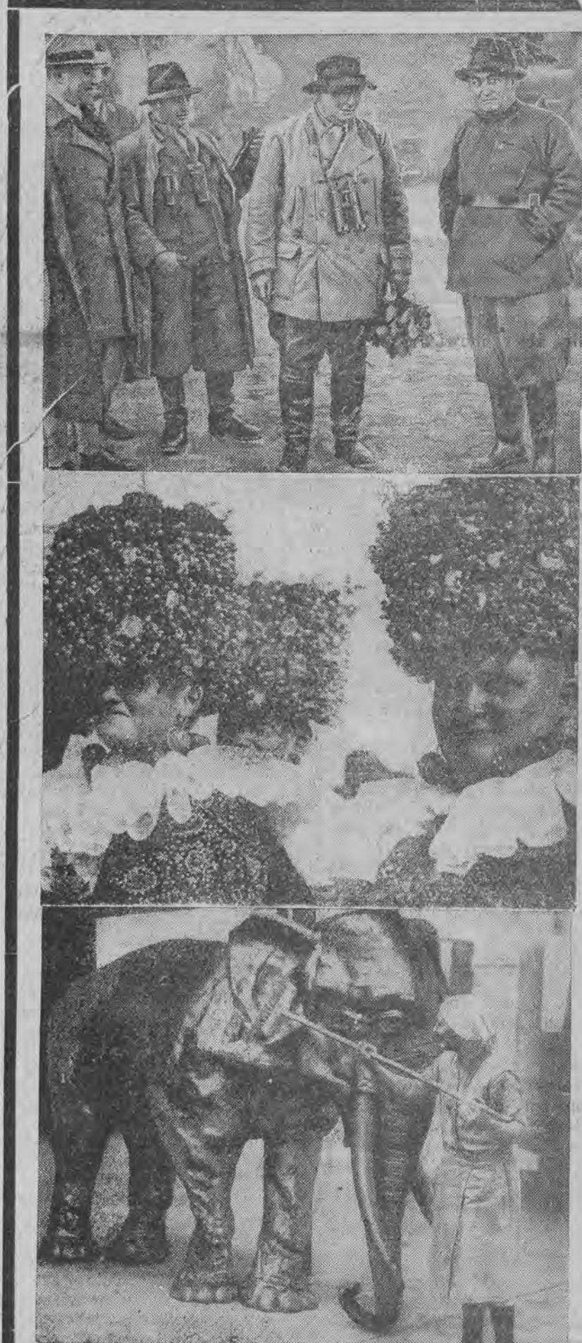
1. Gómbós na polowaniu u Göringa. — 2. Tradycyjne święto dziękczynne za zbiory w Bawarii. — 3. Słoń z faktury na wystawie gospodarstwa domowego w Berlinie.