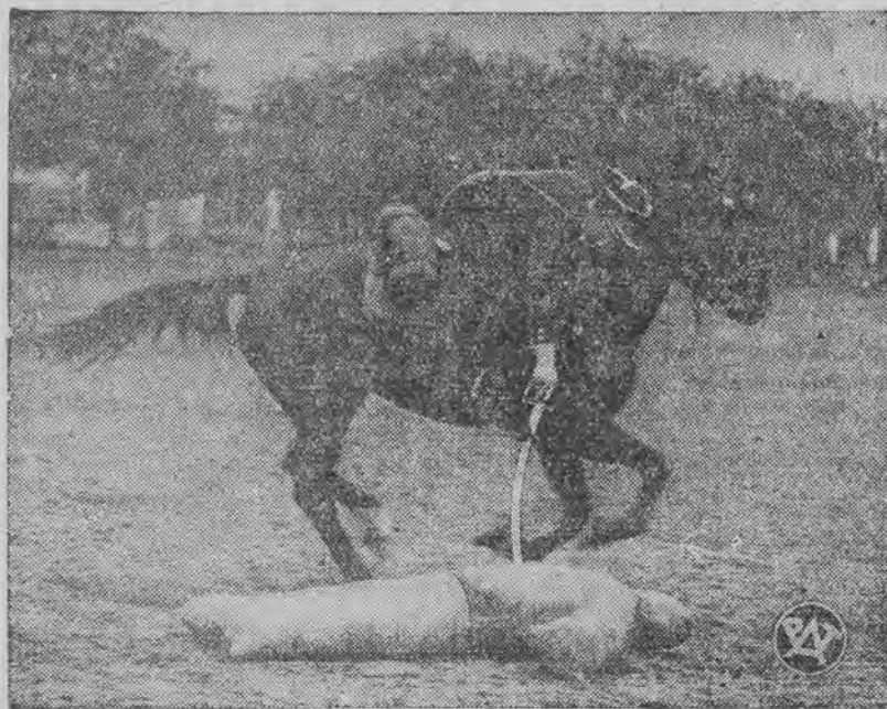
W Warszawie odbywały się zawody konne oficerów artylerii konna. Na zdjęciu jeden z uczestników zawodów „Militari”.