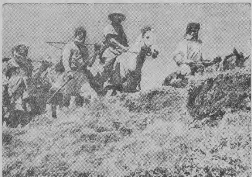
konsul włoski w jednym z miast abisyńskich, powraca pod osłoną wojska tuziemczego do Addis Abeby.