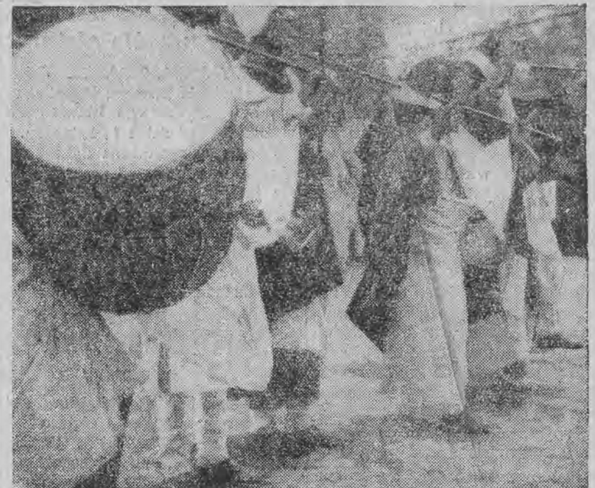
zaopatrzeni w wielkie bębny wojenne, podczas procesji w Addis Abebie. Procesja taka poprzedza wyruszenie na front każdego oddziału wojska.

Sala FILHARMONJI - Dziś, o g. 8.15 ostatni koncert Program wykona MISTRZ fortepianu