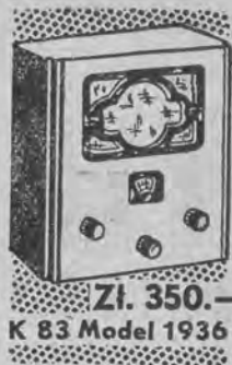
Zł. 350.— K 83 Model 1936

Sąd po zbadaniu świadków skazał Piotrowskiego na 3 miesiące więzienia z zawieszeniem, uznając, że dopuścił się on zniewagi nacz. Illinicza.