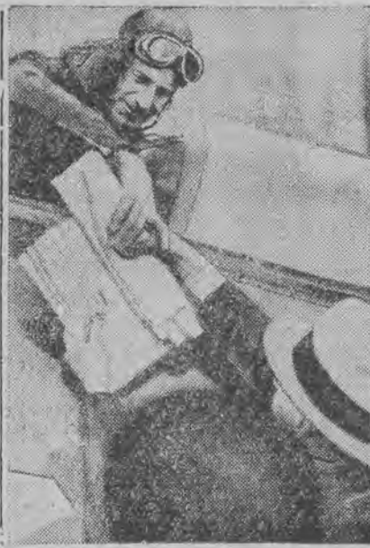
KINGSFORD SMITH, znakomity lotnik angielski, który zginął bez śladu podczas lotu do Australji.

Te względy skłoniły dowódcę eskadry hydroplanów w Singapooru do przeprowadzenia poszukiwań jeszcze przez tydzień. Pomimo krążenia kilkunastu samolotów i wielu okrętów oraz łodzi ratunkowych, nie jest wykluczone, że na