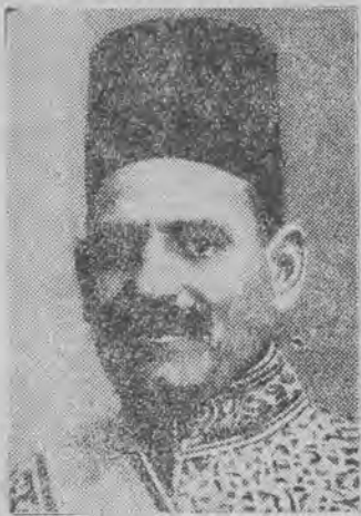
przywódcą nacjonalistów egipskich z partji Wafd, którzy właściwie sprawowali ostatnie krwawe zamieszki.