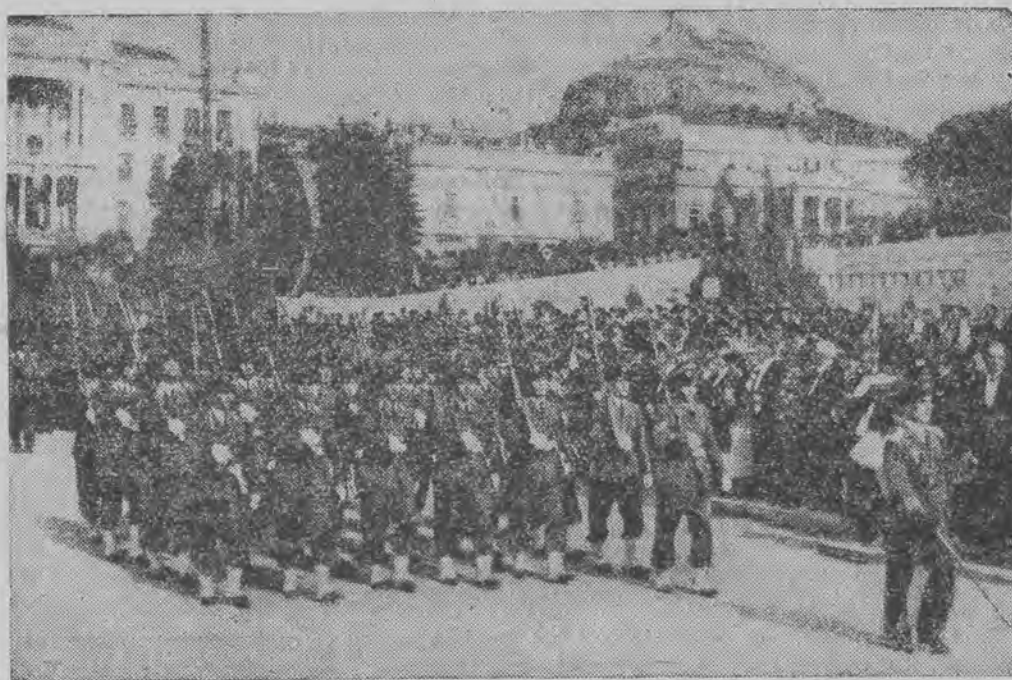
Defilada wojsk lotniczych przed gen. Kondylisem z okazji przywrócenia monarchji. Żołnierze noszą już na czapkach królewskie kokardy.