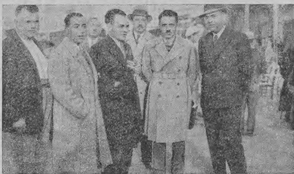
1) Przewodniczący senatu, Ponotos, w otoczeniu grupy więźniów politycznych, ułaskawionych wskutek amnestji, na chwilę przed opuszczeniem więzienia. — 2) Grupa zwolnionych oficerów w z pułkownikiem Tziganesem na czele.