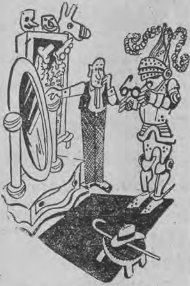
— A jak mam teraz nałożyć okulary?