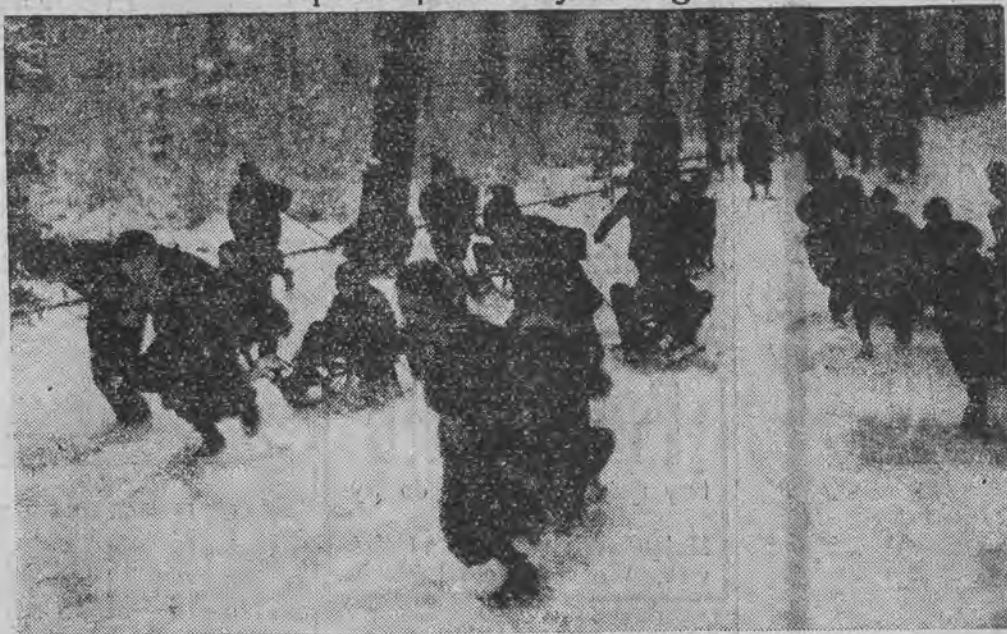
i w parkach miejskich już wre saneczkowanie na całego.