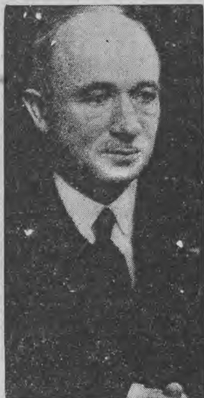
został wybrany prezydentem Czechosłowacji.