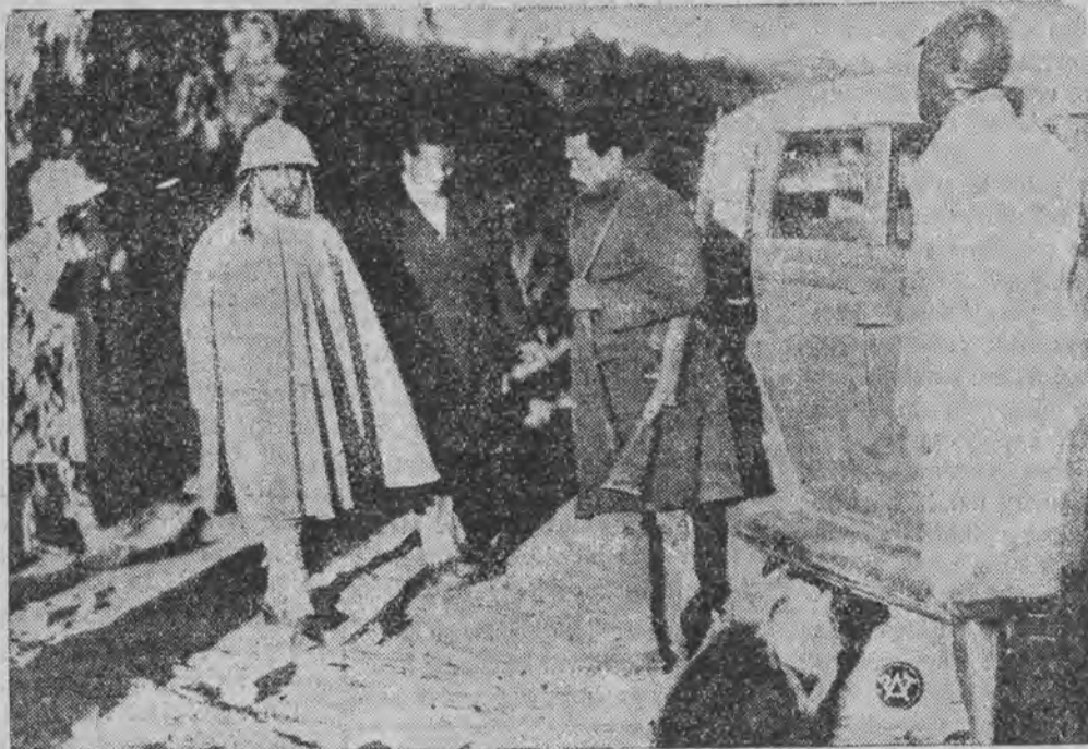
Zdjęcie z ostatniej podróży cesarza Haile Selassie na front i do głównej kwatery wojsk abisyńskich w Dessie, gdzie, jak wiadomo, cesarz był obecny podczas bombardowania tego miasta.