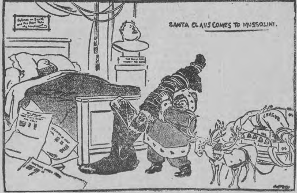
Święty Mikołaj u Mussoliniego

Powstanie wafdistów w Kairze było więc tylko formą wyrazu tego mahometanckiego ruchu wolnościowego i tu zadzierżgnął nić wielki religijny i polityczny reformator Ibn Saud. Podczas pochodu przez miasto studenci do okrzyków swych mieszała zdania z Koranu!