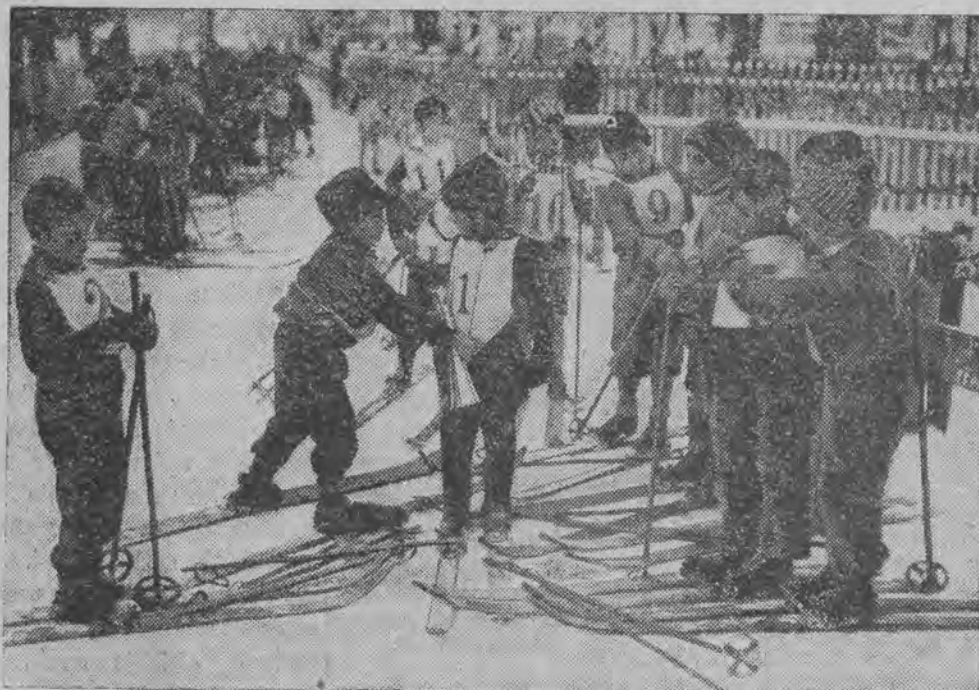
są dla dzieci podniętą do uprawiania tego przepięknego i zdrowego sportu.