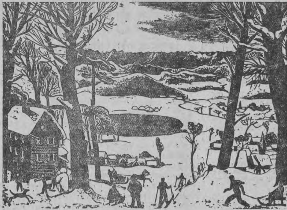
Radość zimy zdała od wielkiego miasta.

I poleciały do śródmieścia, które jarzyło się wszystkimi oknami, grało tysiącami orkiestr, tańczyło milionem nóg.