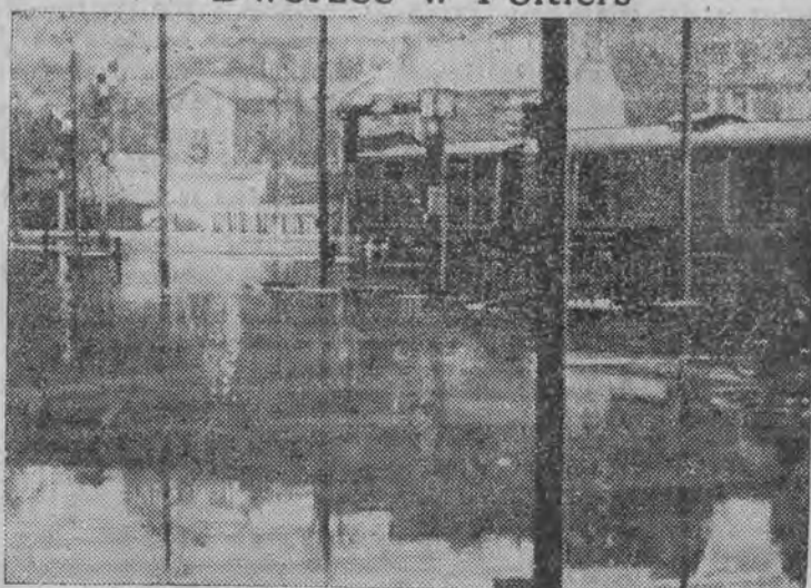
na linii Paryż — Bordeaux, został całkowicie zalany wodą.