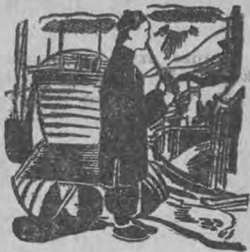
SYMFONJA KAMERALNA W PIATEK 10. I. O GODZ. 22.10