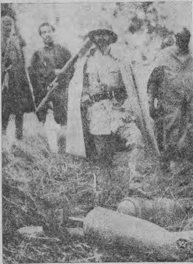
Cesarz Haile Selassie

podczas inspekcji frontu ogląda pociski, które zrzucone zostały przez lotników włoskich, lecz nie eksplodowały.