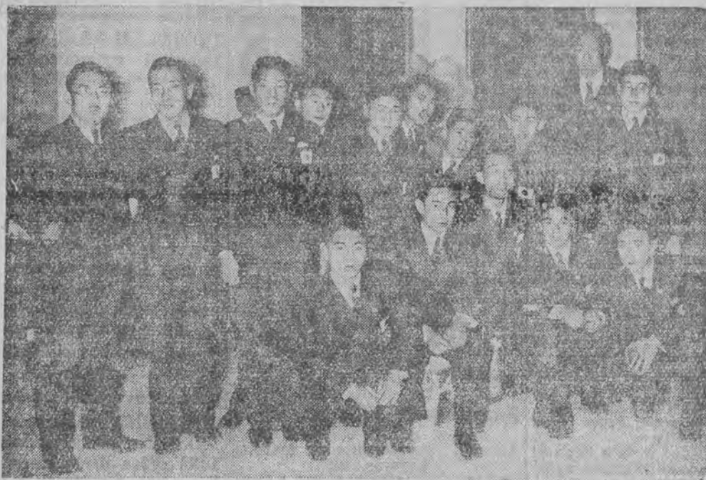
którzy przybyli już do Berlina w drodze na igrzyska olimpijskie.