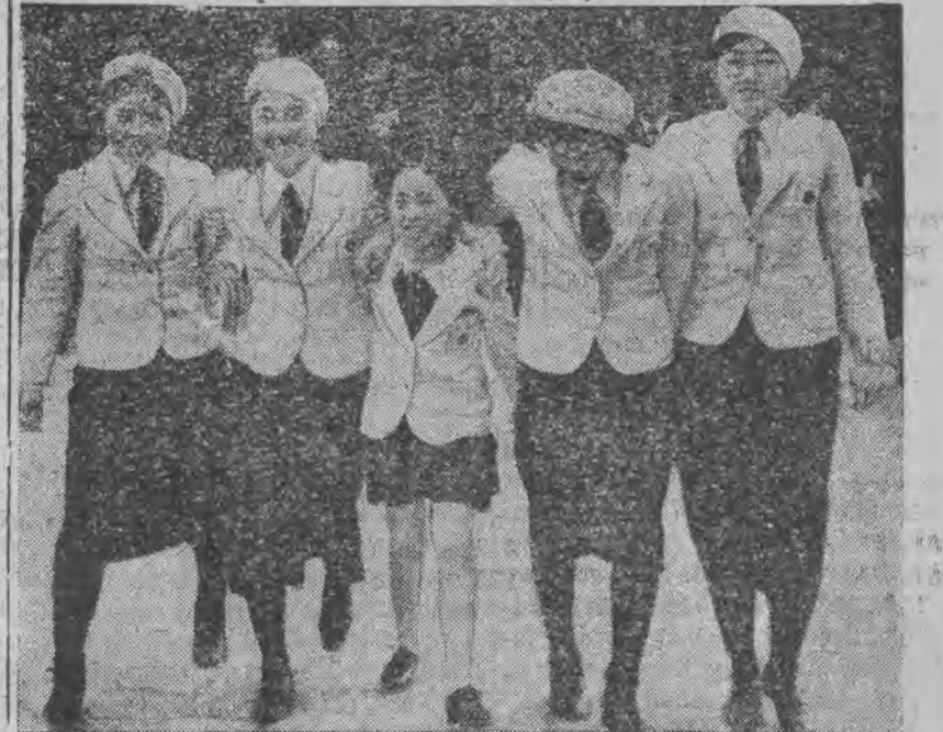
które wraz z fenomenalną łyżwiarką (pośrodku) przybyły na olimpiadę.