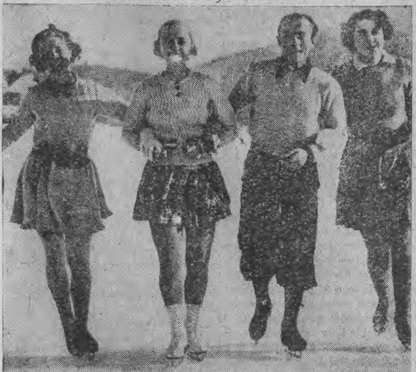
Szwecji, Niemiec, Austrii i Anglii trenują zapamiętane na lodowisku w St. Moritz.