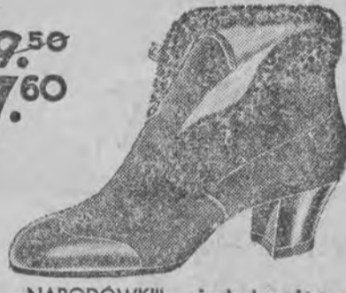
9.50 7.60 „NARODÓWKI” - ciepłe i praktyczne dla Pań. Na słupkowym i niskim obcasie.