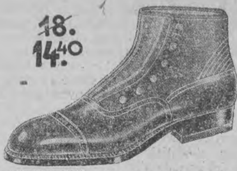
18. 14.40 „DYPLOMATKI” - eleganckie męskie obuwie. Kombinacja geter i półbutów.