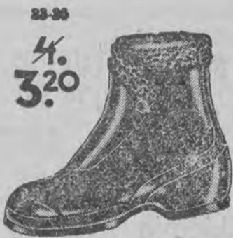
23-26 4. 3.20 Gumowy śniegowiec dla dzieci. Chroni przed przeziębieniem.