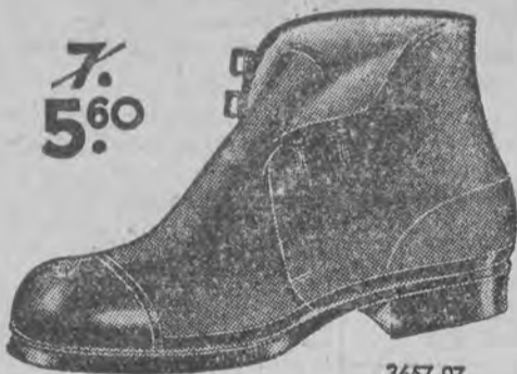
7. 5.60 3657-07 Ciepłe meltonki na gumowych spodach. Wierzch z ciepłego filcu.