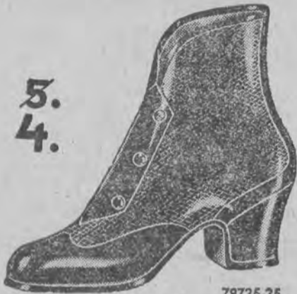
5. 4. 78735-35 Przed przeziębieniem chronią nasze śniegowce.