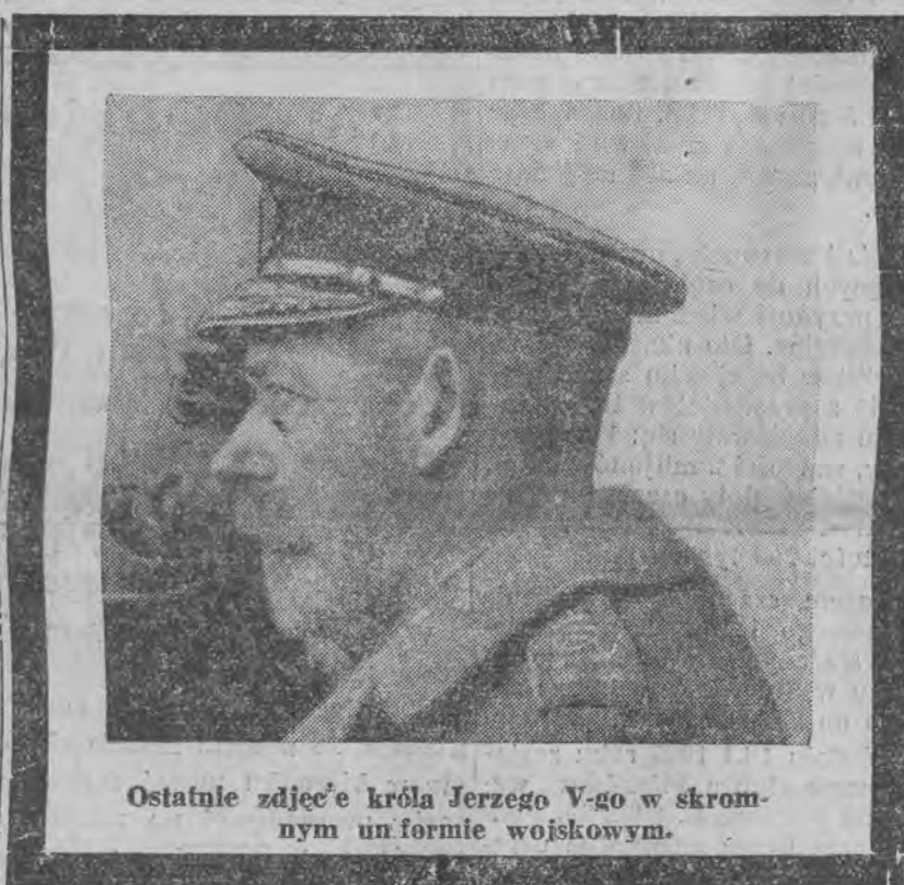
Ostatnie zdjęcie króla Jerzego V-go w skromnym unformie wojskowym.

Ludność Sandringham, która doskonale zna króla, opowiada, że jeszcze w środę, kiedy na swym ulubionym wierzchołku pojechał na spacer, wyglądał doskonale. Powszechnie twierdzą,