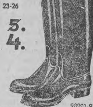
23-26 5. 4. 98991-93 „GENERALKI” - calogumowe wysokie buty. Dla dzieci w niepogody.