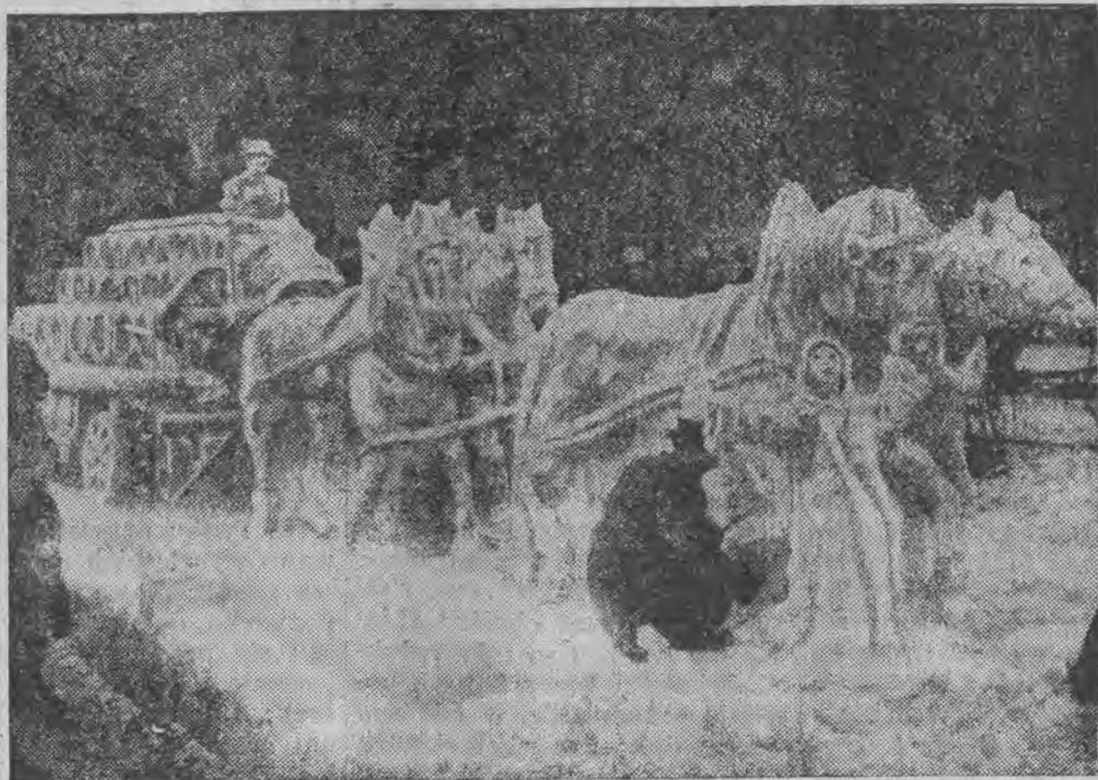
przedstawiająca wóz z piwem, została ulepiona przez monachijskiego malarza dekoracyjnego, Sailera, na jednym z placów stolicy Bawarii.