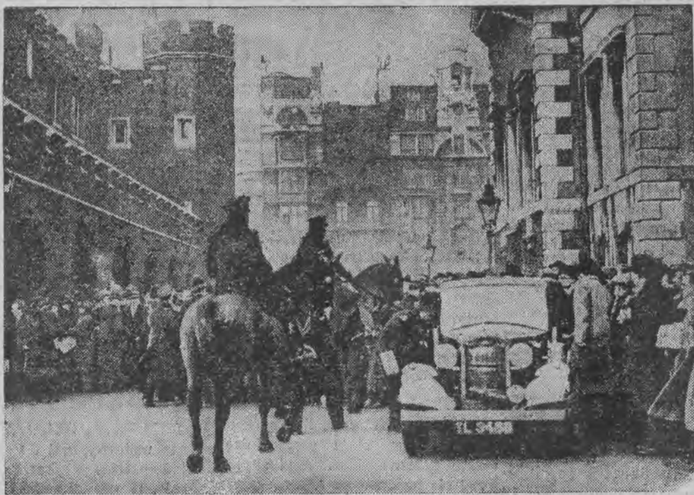
Thum przed pałacem Buckingham podczas uroczystego składania przysięgi przez nowego króla Edwarda VIII.

Książę śmiał się, ale ja nie mogłem tak szybko przejść do siebie. Po tem wrócił do sztabu na moim motocyklu.