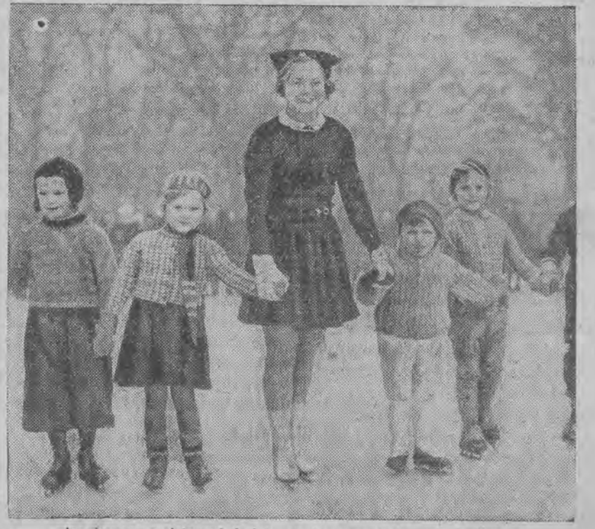
niepokonana mistrzyni świata, w towarzystwie młodocianych adeptów łyżwiarstwa.