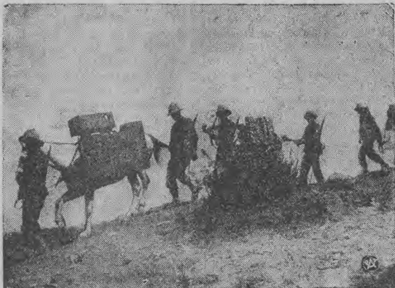
Uciążliwy transport broni przez piaski pustynne.

KOMUNIKAT Polskiego Biura Podróży „ORBIS” w Łodzi, Piotrkowska 18 tel. 249-53 i 249-40 NAJTAŃSZE WYCIECZKI DO PALESTYNY NA PURYM, PESACH I TARGI LEWANTYŃSKIE 2 wycieczki do WIEDNIA 9 lutego od zł. 95.— Zapisy do 3 lutego. Wycieczka do Londynu i Birmingham na Targi Berytyjskie. od 15. II do 26. II 36 r. Cena od zł. 910 Zapisy do dnia 5. II 36. Wycieczka do HISPANJI NA MAJORKE 20. II do 9. III. Warszawa, Berlin, Genewa, St. Moritz, Nizza, Barcelona, Palma na Majorce, Strassburg, Drezno, Warszawa. Cena zł. 950. Ulgiwe PASZPORTY zagraniczne.