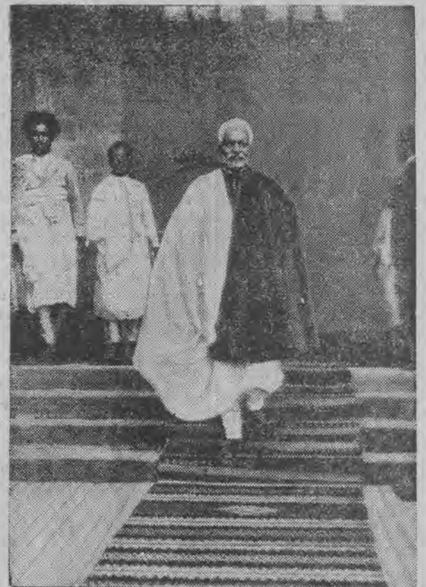
Ras Mulugueta sędziwy minister wojny Abisynji, którego oddziały biorą udział w walkach pod jego osobistym dowództwem.