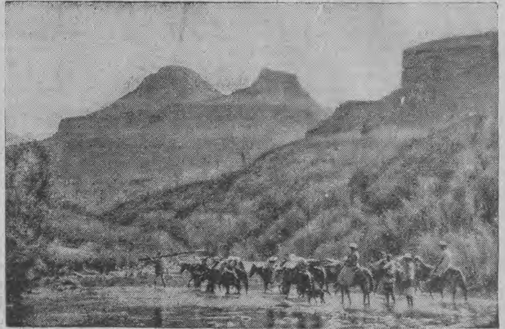
W północnej Abisynji. Karawana w dolinie rzeki Tselari