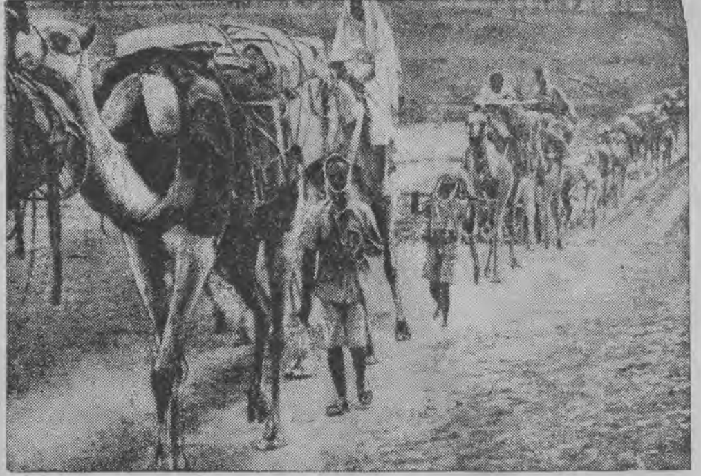
Transport prowiantu do przednich linii na froncie południowym w Abisynji.