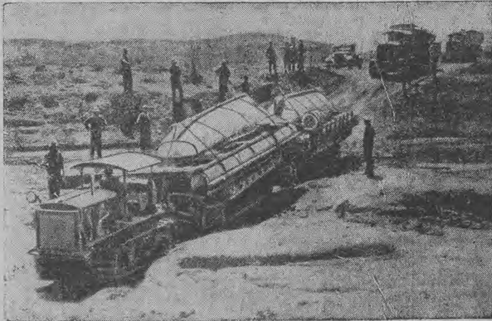
Karawana samochodów włoskich transportuje za frontem somalijskim materiał do budowy mostu przez rzekę Džuba.