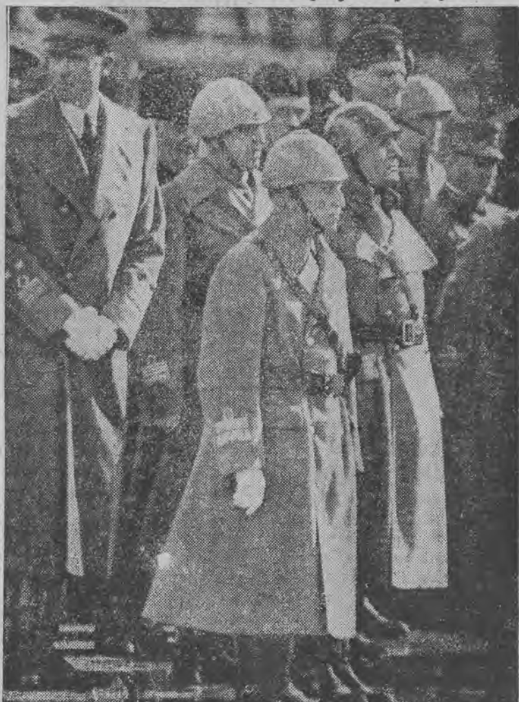
Z powodu zwycięstw, odniesionych w Abisynji, odbyły się w Rzymie uroczystości przed pomnikiem Wiktora Emanuela