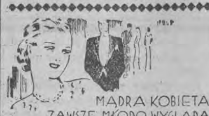
MADRA KOBIETA ZAWSZE MŁODO WYGLĄDA

— Walki partyjne są chyba u was również nieznane?