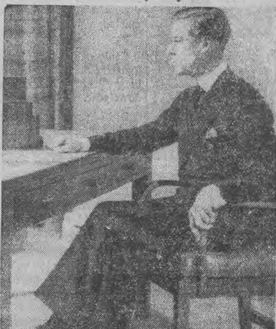
Edward VIII wygłosił w niedzielę, pierwszą swą mowę radiową. Na zdjęciu widzimy monarchę angielskiego przed mikrofonem broadcastingu londyńskiego