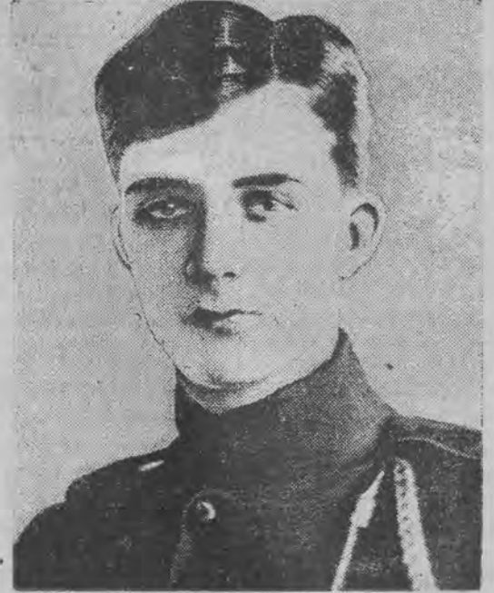
Król Belgji Leopold III

Po audjencji u króla minister Beck oświadczył, iż jest szczególnie wzruszony wyróżnieniem, jakie król Leopold III okazał, przyjmując polskiego ministra spraw zagranicznych z odznaką Krzyża Walecznych na piersiach.