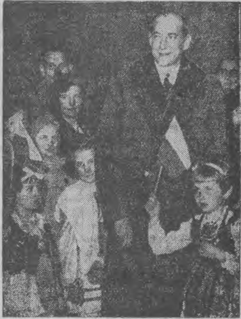
Bzieci kolonji polskiej w Belgji w strojach narodowych witają ministra.

Król Leopold miał na piersiach Krzyż Walecznych, który kilkanaście lat temu otrzymał z rąk ministra Becka