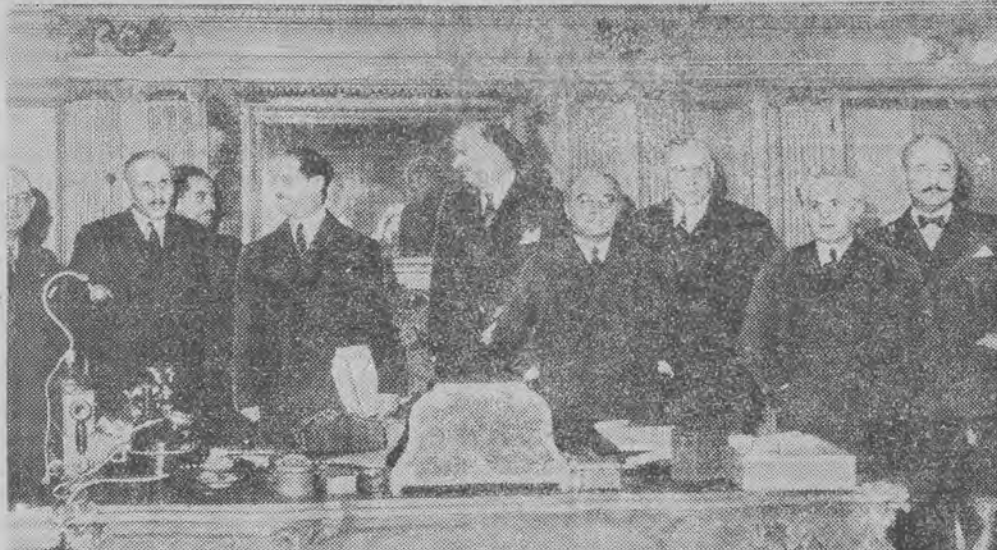
Od lewej: Francois Poncet (Berlin), Paul Boncour, Chambrun (Rzym), premier Sarraut, min. spr. zagran. Flandin, Leger, Corbin (Londyn), Laroche (Bruksela)