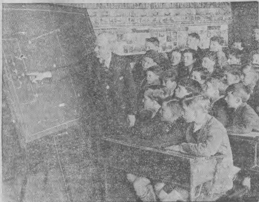
Obowiązkowe wykłady futbolu w szkole Springfield - Council w Sheffield (Anglja).