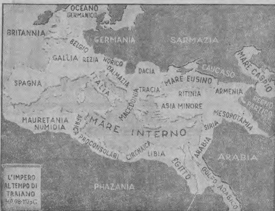
Dawne imperjum rzymskie

Starożytny Rzym mógł się oprzeć na niespornym fakcie, że był jedynym posiadaczem nowoczesnej broni. Nie miał on za czasów Chrystusa wogóle żadnego poważnego rywala na terenie europejskim — oprócz rosnącej rywalizacji, która powstała z wewnętrznych napięć w państwie, a które wreszcie doprowadziły do zguby Rzymu właśnie wskutek broni, która obecnie została podzielona rów-