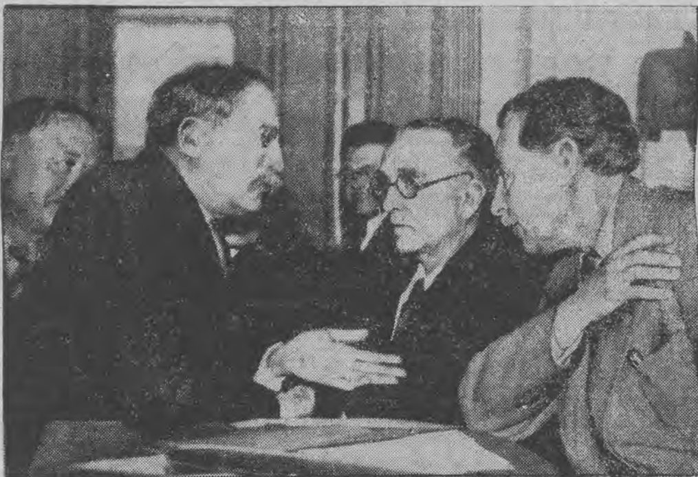
Blum prowadzi konferencję z przywódcami partji przed objęciem szefostwa gabinetu.