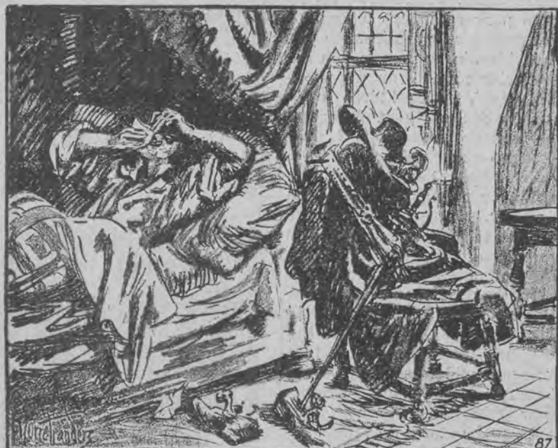
87. PACHNĄCY LIŚCIK.