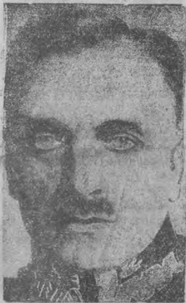
GEN. FELICJAN SŁAWOJ-SKŁADKOWSKI