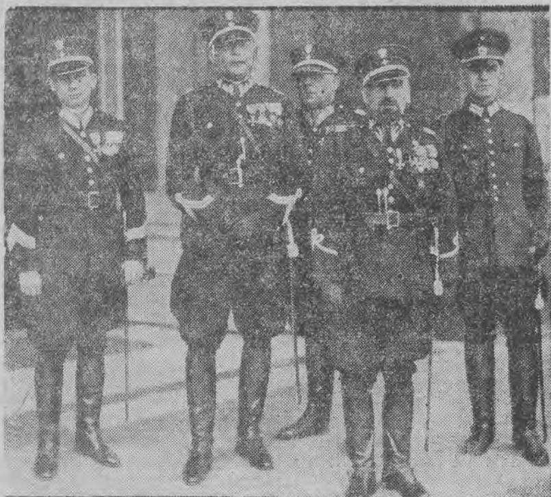
Jak już donosiliśmy komendant główny policji gen. Kordjan-Zamorski (drugi od prawej) udał się do stolicy Rzeszy, aby się zapoznać z tamtejszymi urządzeniami władz bezpieczeństwa.