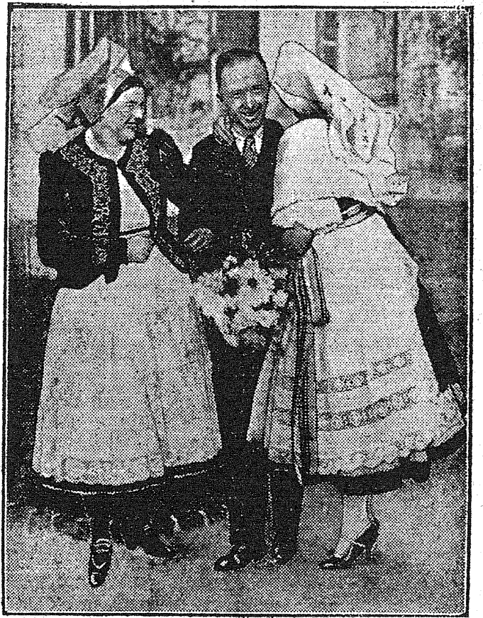
Na zaproszenie niemieckiego towarzystwa lotniczego „Ila” przybył w tych dniach do Berlina, Chamberlin znany z przelotu Ameryka — Niemcy. Z Berlina Chamberlin udał się do Chociebuża, którego jest honorowym obywatelem; gdzie go owacyjnie witano.

Dwie najładniejsze Chociebużanki nie szczędzą mu na dworcu całusów.