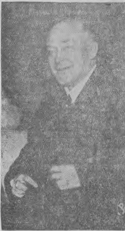
opuścił placówkę paryską.