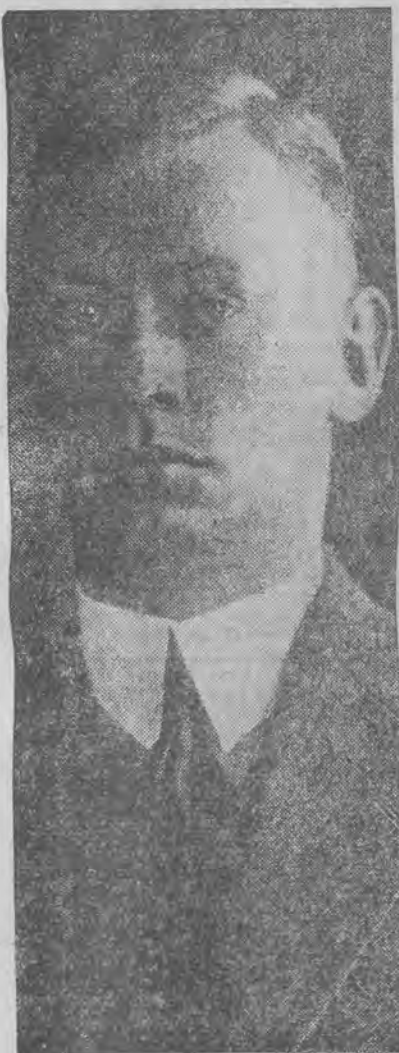
objął placówkę paryską po p. Chłapowskim.