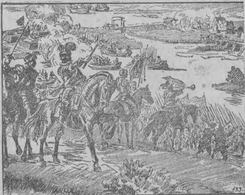
133. DECYDUJĄCA BITWA Król, który nienawidził Buc-

kinghama z wielu jeszcze innych względów, niż kardynał, zastał