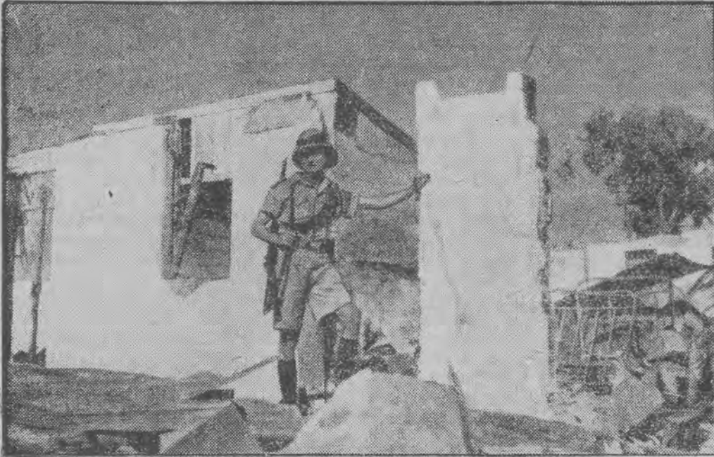
Zburzony dom w Jaffie od wybuchu bomby w czasie rozruchów arabskich.