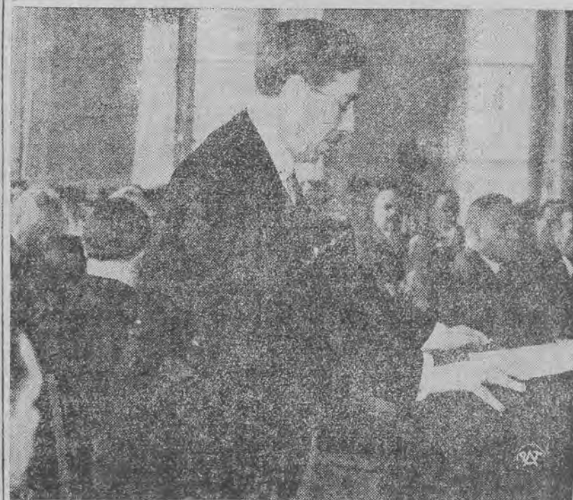
Wicepremier Kwiatkowski przed komisją sejmową plan czteroletniej mobilizacji finansowej.