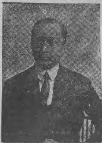
Nowy ambasador R. P. w Moskwie