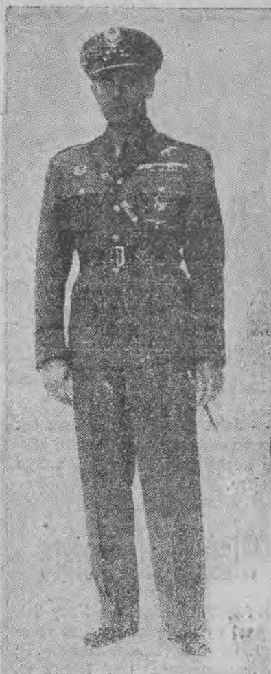
Ukazał się rozkaz min. spraw wojskowych, wprowadzający nowe przepisy, dotyczące umundurowania żołnierzy lotnictwa. Na zdjęciu widzimy oficera lotnictwa w mundurze nowego wzoru (en face).