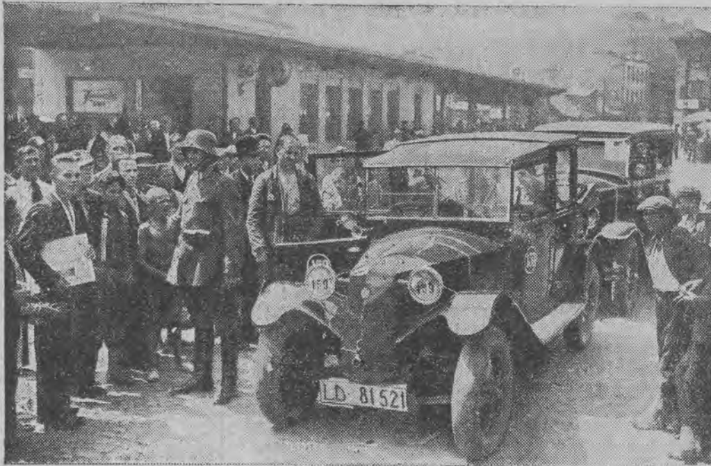
Przed stacją tramwajów dojazdowych usiłowali wykorzystać kilkugodzinny zatarg taksówkarze łódzcy.

W dniu wczorajszym nad ranem wybuchł niespodziewanie strejk na łódzkich tramwajach podmiejskich. Po bezowocnej konferencji onegdajszej pracownicy oddziału drogowego i mechanicznego, którzy wysunęli żądania podwyżkowe, udali się niezwłocznie do remiz i jeszcze onegdaj rozpoczęli okupację warsztatów w remizach w Helenówku i Ciechanowicach. — Strejkujący zwrócili się jednocześnie do pracowników oddziału ruchu, t. j. do konduktorów i motorniczych z wezwaniem, aby poparli ich akcję strejkową. Służba ruchu przyłączyła się częściowo do akcji, uinieruchamiając wczoraj rano część wozów na liniach podmiejskich.