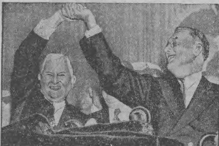
Partja demokratyczna Stanów Zjednoczonych A. P. ponownie wysunęła na urząd prezydenta i wiceprezydenta Roosevelta i Garnera. Obaj kandydaci ściskają sobie ręce.