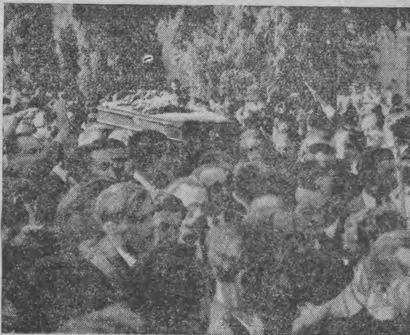
W Madrycie odbył się pogrzeb za morderzanego przywódcy prawicy, Calvo Sotelo, na który przybyli jego stronnicy z całego świata.