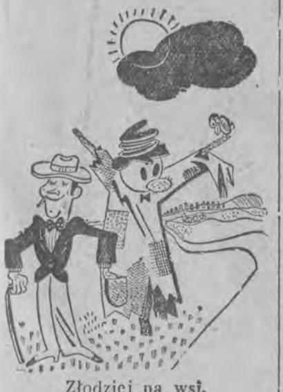
Złodziej na wsi.