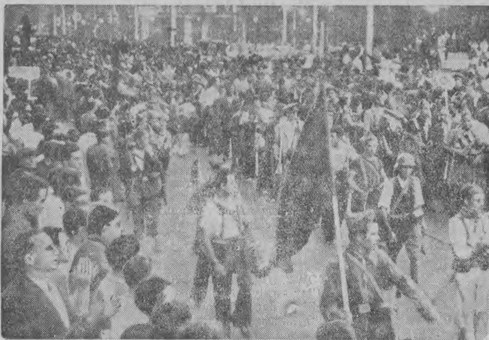
Milicja ludowa w marszu przez ulice Barcelony

Walec wodnoplawcy z łodzią mi podwodnymi przyglądały się z pobliskiej plaży setki osób, które kąpały się w tym czasie.