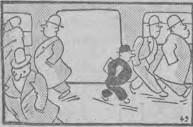
Olbrzym, który był karzełkiem