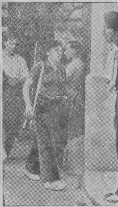
Nawet kobiety są uzbrojone.

Radio portugalskie zawiadamia, że rząd francuski sprzedał większą ilość samolotów rządowi hiszpańskiemu oraz że okręty niemieckie dokonają demonstracji w razie niedostatecznej obrony interesów obywateli niemieckich, przez rząd hiszpański.