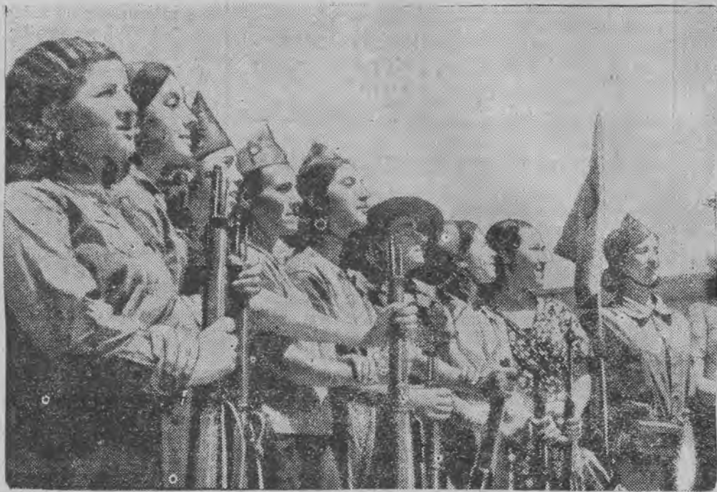
HISZPANKI CHWYCIŁY ZA BRON.