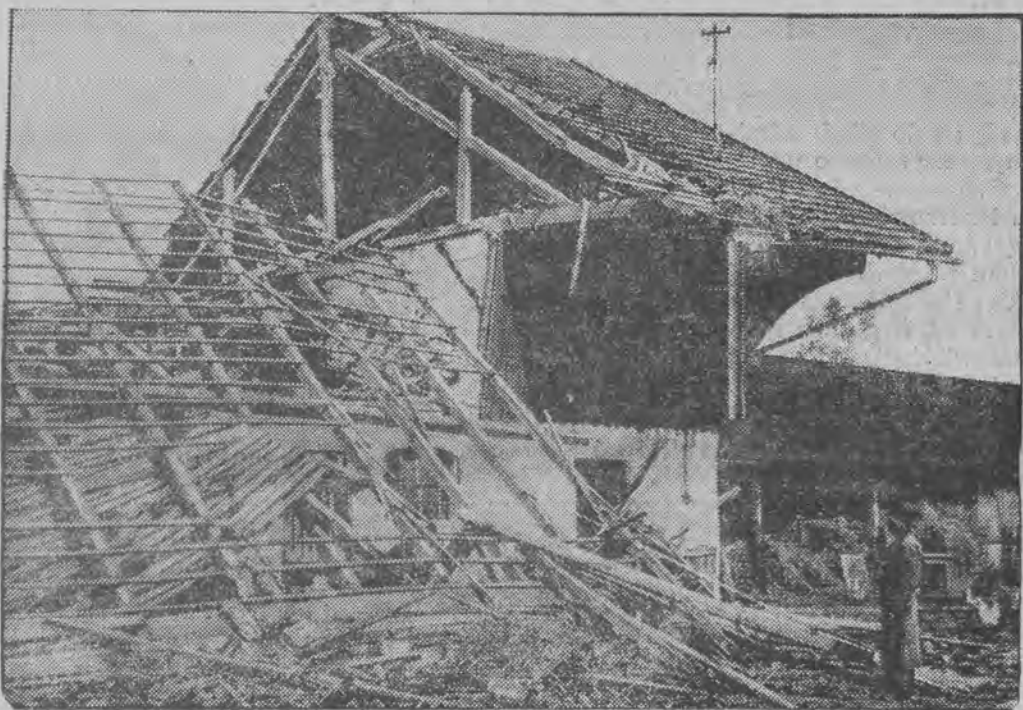
Cyklon spowodował olbrzymie szkody, zrywając dachy domostw i niszcząc całe miasteczka.