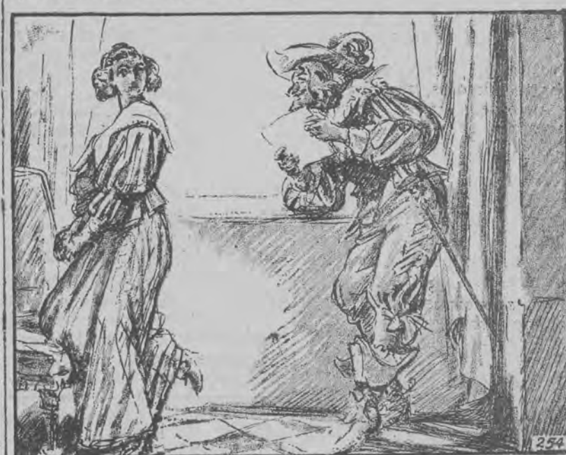
— Nazwy miejscowości jeszcze nie wpisałem. — przerwał lord.

Milady nie odpowiedziała ani słowa. Nie dlatego, aby nie chciała powiedzieć, lecz ponieważ strach pozbawił ją mowy. Była przekonana, że rozkaz ten zostanie natychmiast wykonany, ale z niezmierną ulgą stwierdziła, że dokument nie był jeszcze zaopatrzonej w niezbędny podpis.