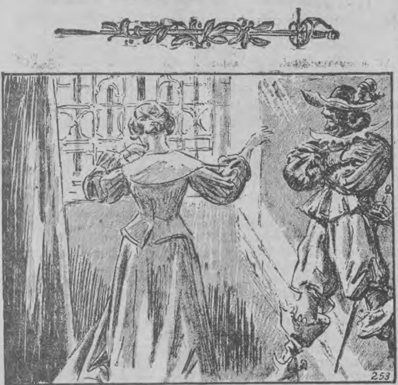
253. PRZY OKNIE Następnego ranka Felton zjawiał się o zwykłej godzinie. Mila-

Powieść w ilustracjach wg. Aleksandra Dumasa