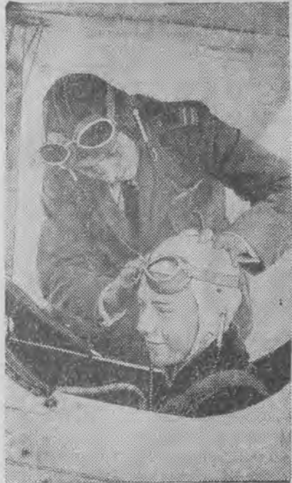
plywaczka holenderska, zdobywczyni złotego medalu za 100 metrów na plecach, kształci się obecnie w kierowaniu samolotem