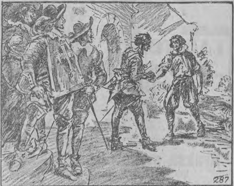
287. DROBNY HANDEL.

— Ten przeklęty człowiek! — wołał d'Artagnan. — Mój zły duch, którego zawsze spotykam gdy czeka mnie coś złego. To on właśnie towarzyszył tej okropnej kobiecie, gdy ją ujrza-