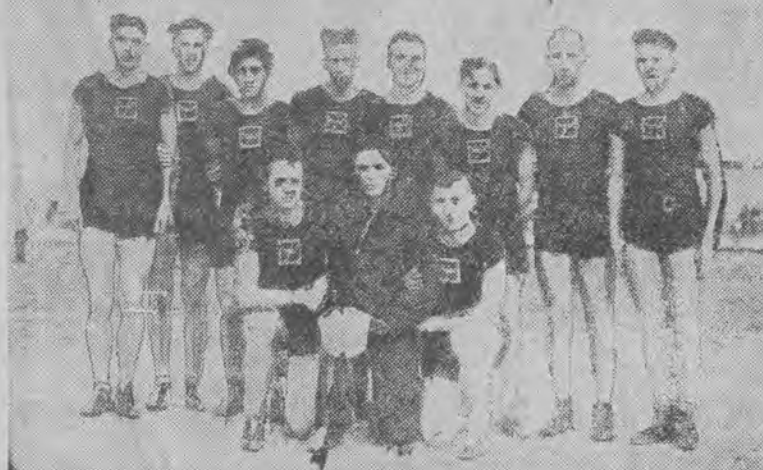
która w niedzielę pokonała zespół Warszawy 8:3