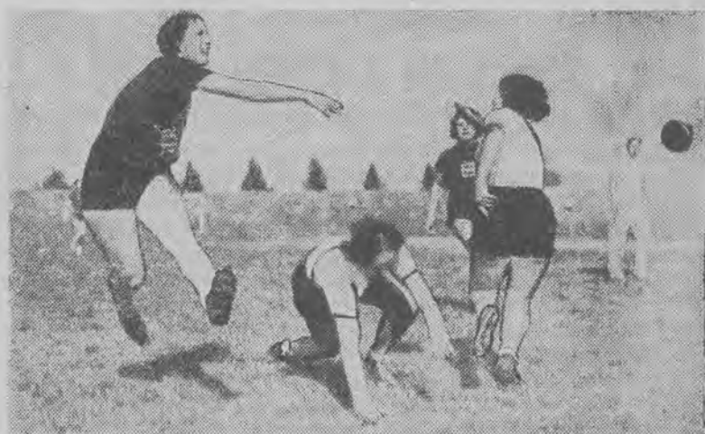
w czasie meczu hazeny Łódź — Warszawa (8:3).