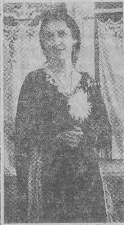
Miss Europą na rok 1936 została wybrana królowa piękności Miszpanki, której podobiznę reprodukuje