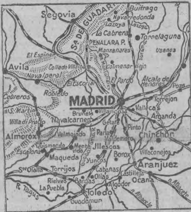
Mapka przedmieść i najbliższych okolic Madrytu. Na południu od stolicy widoczna miejscowość i lotnisko Getafe, zdobyte przez wojska powstańcze.

Przedmieście Madrytu i koszar CARABANCHEL SA OBECNIE OSTRZELIWANE przez artylerię powstańcza.