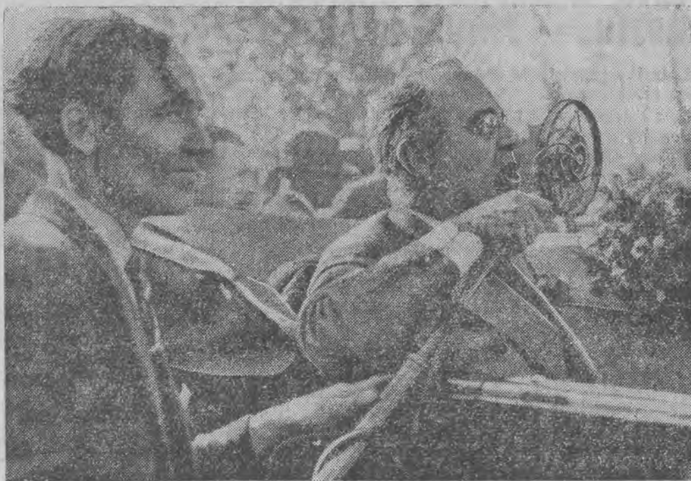
Prez. Roosevelt w chwili wygłaszania mowy wyborczej przez radio.

Franklin Delano Roosevelt urodził się dnia 30 stycznia 1882 roku w Hyde Park w stanie nowojorskim. Po odbyciu studiów w Harvard University, uczęszczał on jeszcze przez 3 lata do Columbia Law School i w roku 1907 rozpoczął w Nowym Jorku karierę adwokacką. W roku 1910 wybrany był do nowojorskiego senatu stanowego. W r. 1913 cofał się z senatu, będąc powołanym na stanowisko zastępcy sekretarza w urzędzie morskim. — Na stanowisku tym pozostawał i w czasie wojny światowej, przy czym od lipca do września 1918 roku był członkiem inspekcji amerykańskich sił morskich na wodach europejskich.