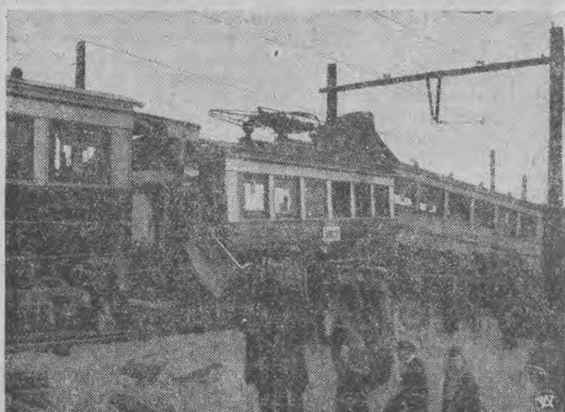
na linii elektrycznej kolei dojazdowej Grodzisk — Warszawa w pobliżu przystanku Szczęśliwice. Zdjęcie dokonane bezpośrednio po katastrofie.