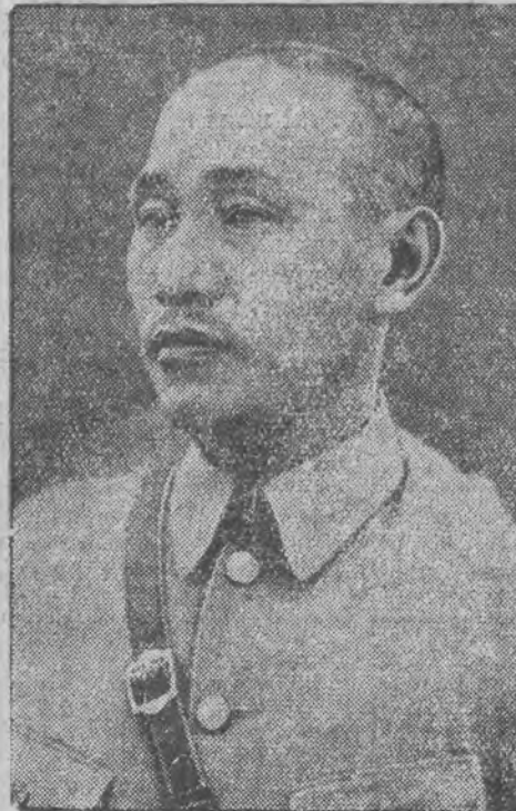
Uwięziony marszałek Czang-Kai-Szek.