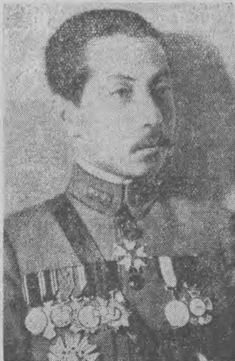
Wódz rebelii marsz. Czang-Sue-Liang

Wydział wykonawczy (Juan) Kuomintangu uchwalił dziś rezolucję, głoszącą, że nadal prowadzić będzie dotychczasową politykę zagraniczną i walkę z inwazją mandżursko-mongolską do Suljuanu.