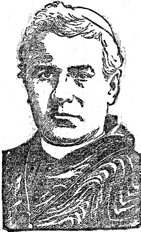
PIUS X, PAPIEŻ.

Pius X pochodzi z drobnej wiejskiej rodziny włoskiej, której dokumenty sięgają 17 wieku. W tym czasie mieszkał pod Padwą Paweł Sarto, zdaje się, że krawiec, jak to nazwisko Sarto wskazuje; miał on dwóch synów: Wincentego i Jana; Pius X pochodzi od pierwszego. Urodził