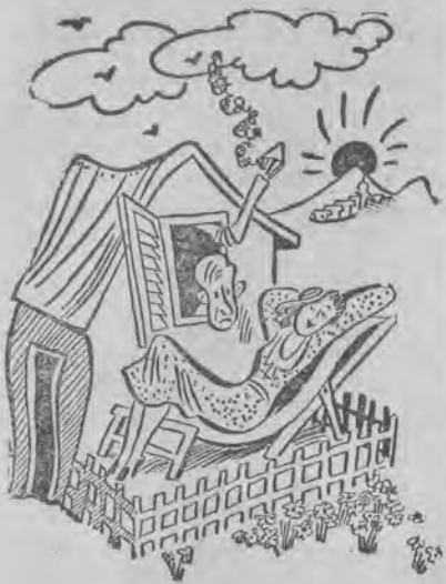
— Puść mnie trochę do ogródka. Teraz moja kolej.