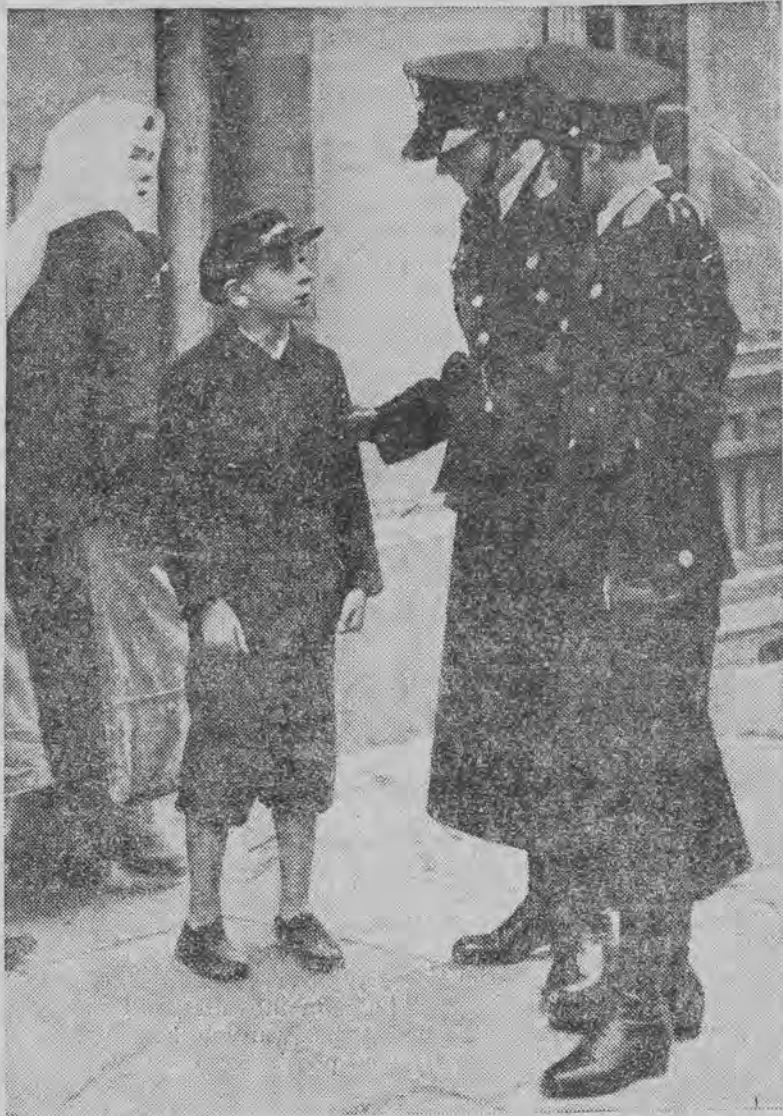
„Jak się nazywasz i gdzie mieszkasz?” — pyta „pani władza” młodego warszawskiego Gawroche'a w czasie patrołowania ulic stolicy.

Izba zatrzymań mieścić się będzie w domu przy ul. Kopernika 36. Będą tam sale sypialne, świetlice, łazienki i prysznice.