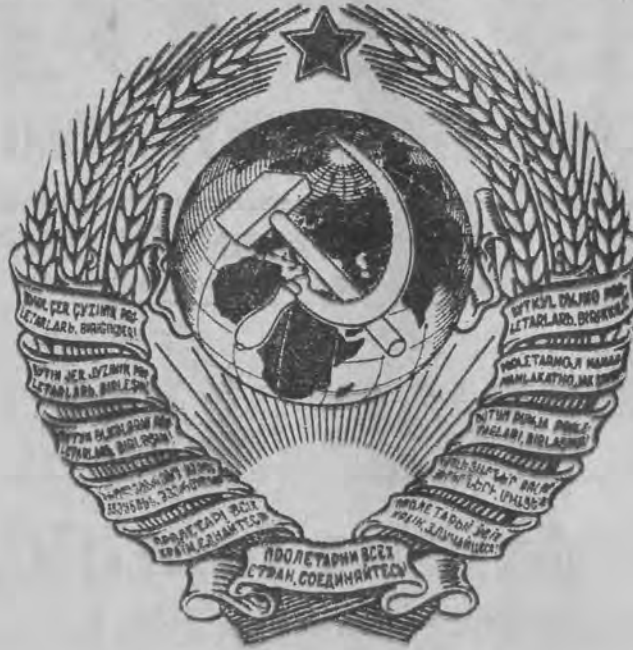
Nowe godło Z. S. S. R.