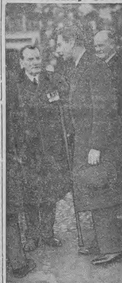
w rozmowie z inwalidami wielkiej wojny.