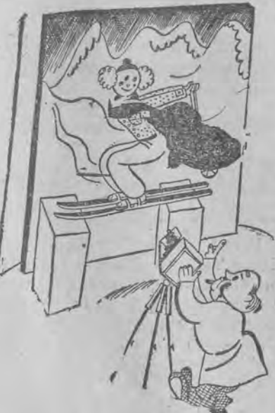
JAK POWSTAJĄ brawurowe zdjęcia z Zakopanego.

W gimnazjach żydowskich wakacje wielkanocne rozpoczną się dopiero od jutra po lekcjach i trwać będą do dnia 4 kwietnia włącznie.