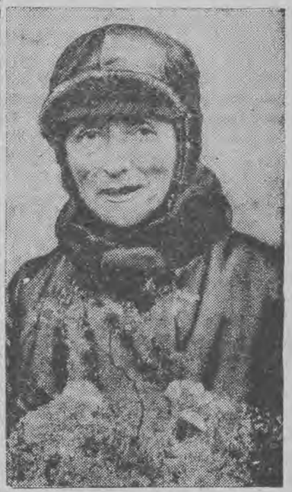
71-lenia niezmordowana pilotka zagłębia podczas lotu i jest poszukiwana przez eskadry samolotów.