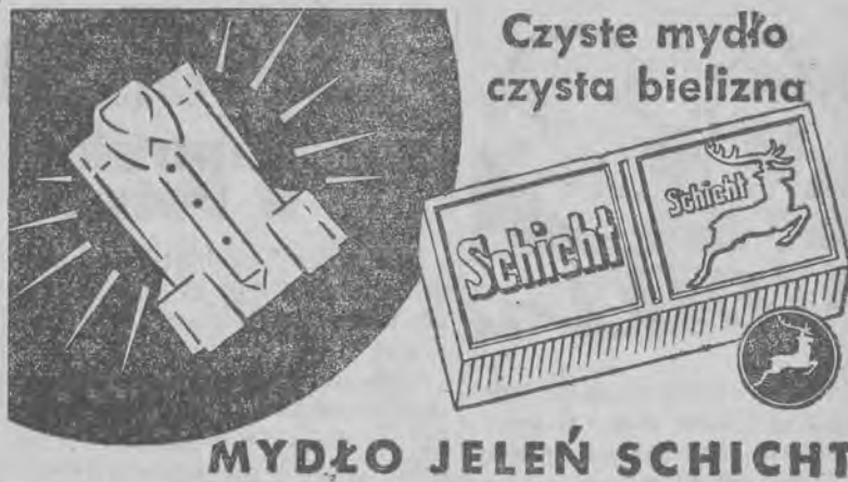
MYDŁO JELEŃ SCHICHT